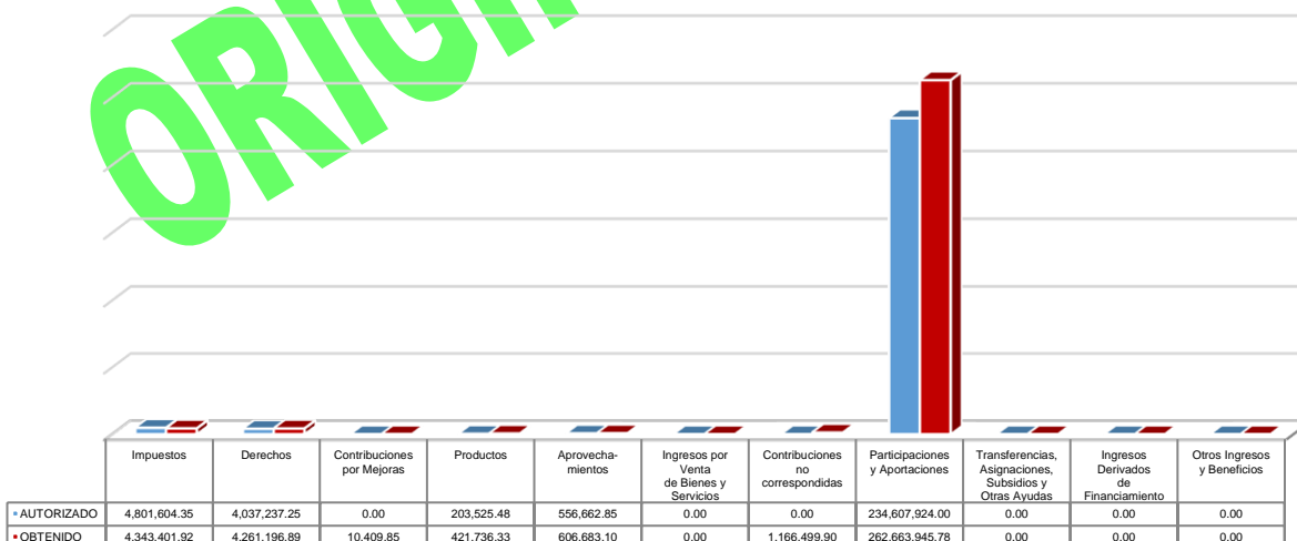
Gráfico 4. Ingresos